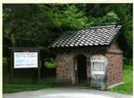
砖瓦构造的单人牢房