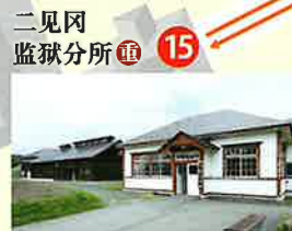
二见冈 监狱分所 15