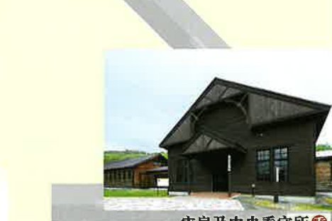
牢房及中央看守所 18