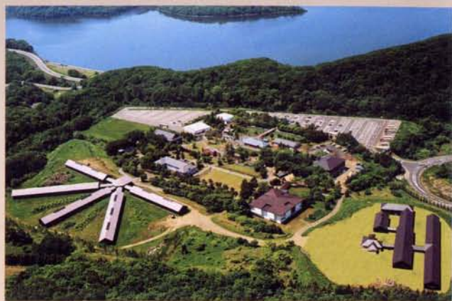
15 五翼辐射状牢房(移筑、复原) 明治42年由于发生火灾，原来并列式的牢房被烧毁，后来于明治45年重建的此牢房。自那以后，此牢房到昭和59年9月为止，一直是网走监狱最重要的建筑物。但在昭和60年根据监狱的设施重建计划，新建了钢筋混凝土的现代化牢房。将原来的牢房改建为博物馆。