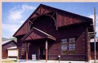
16 牢房(移筑、复原) 正门入口处有八角形的哨所。从这里可以监视五栋牢房的详细情况。