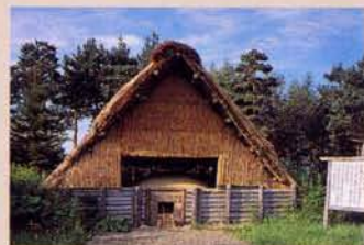
21 烧制木炭的小屋(再现) 作为燃料用的木炭也完全可以自给自足。其茅草屋使人不由得回想起往昔。