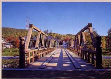
1 镜桥(再现) “镜桥”是犯人出、入狱时必须通过的桥。其含意是“在水面上反映自我，正襟清心。”“镜桥”就是由此而得名。