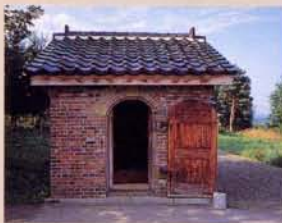
18 用砖瓦建的独居房(惩罚房)(移筑、复原) 在监狱内有粗暴行为和违反命令的，作为惩罚就要使其在没有窗户、一片漆黑的独居房里住七个昼夜。