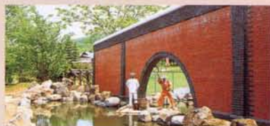
6 网走刑务所水门(再现) 网走监狱的前方流淌着网走河。网走监狱利用这条河运入生活物资，并往农场运输肥料等，把它作为贵重的水路而充分利用了。砖制正门开工时建造的这个门，其后直到1956年为止一直被很好地利用了，但是在“纪念桥”撤去之际被封锁了。