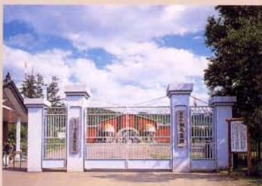
2 网走监狱博物馆入口(再现) 正面入口处的大门是模仿郊外网走监狱二见丘农场的大门建造的。