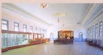
22 教诲堂(移筑、复原) “教诲堂”是让犯人反省自己所犯罪行，并也是教育他们重新做人的地方。在监狱内的建筑物中，此堂是最庄严的建筑，正面设有祭坛，是受刑者们悔过自新的理想之地。