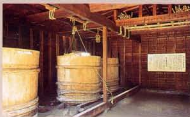
11 咸菜库(再现) 冬季由于蔬菜不足，因此网走监狱把秋季收获的蔬菜储存在咸菜库里。在高和直径均为1.6米的大木桶里大约腌3,000根左右的咸萝卜。其味道被誉为“天下第一”。