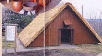
9 宿舍(再现) 这是为了到远处作业而建造的临时宿舍。别名移动监狱(章鱼屋)。