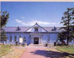
4 办公室 (移筑、复原) 此建筑是明治45年所建。它带有浓厚西方的风格并保留了明治办公建筑的特点。内有会客室和所长室等。