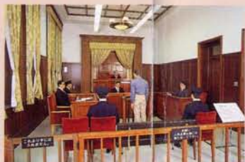
7 法院的法庭(移筑、复原) 此法庭是将昭和27年至平成3年钏路地方法院网走分院使用过的一部分移筑到这里的。