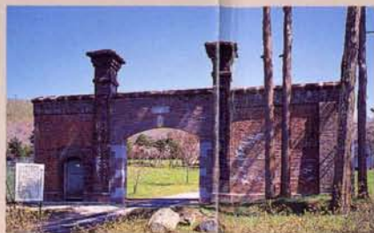
5 后门(移筑、复原) 一般叫“便门”。是服刑者出外劳动时通行的门。它是大正8年建砖围墙时，最先建造的门。