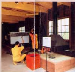
10 耕耘库(再现) 以农场监狱而闻名全国的网走监狱，引进了美国的现代农业制度，其技术非常先进。这里存放了当时使用的农具和收获物。