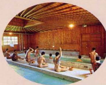
17 浴池(再现) 由于很多人在一起生活，特别容易发生皮肤病等疾病。再说从卫生方面考虑也应该建这样的设施。洗澡是监狱生活中最高兴的一刻。