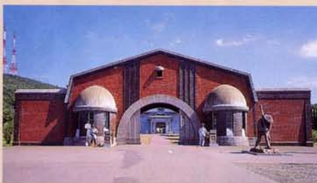
3 正门(再现) 通称“红砖门”的网走监狱的正门威严庄重，它使人不由得想起曾被称为“最边远监狱”时代的威严。就像明信片等所介绍的那样，正门特别有名，其大小与原来的尺寸相同，是博物馆的象征。